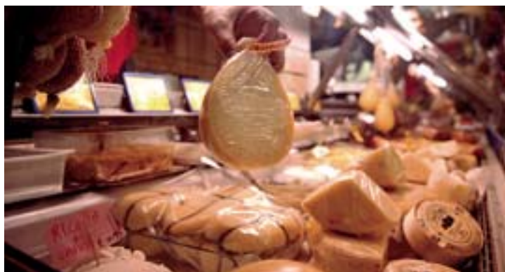
Ecceденze alimentari Il convegno si terrà alla Fiera del Levante

Tra i partecipanti anche l'associazione Orizzonti che - si legge in una nota dell'associazione che opera nella provincia della Bat - «parla di "emergenza cibo" e circolo virtuoso dello scarto alimentare dal lontano 2008. Ora Orizzonti - continua il comunicato - invitata tra le eccellenze del sociale porterà la sua testimonianza frutto di un lavoro "di trincea" quotidiano vissuto proprio tra le nuove povertà nella distribuzione delle ecceденze alimentari e del cibo prossimo alla scadenza ma ancora buono».